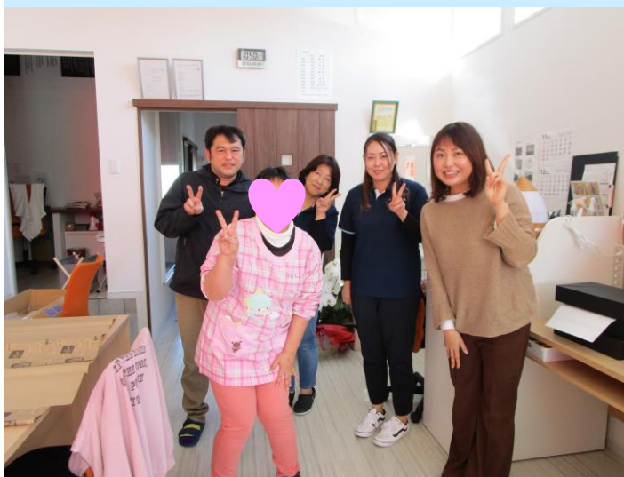
ななーらミラクルにて