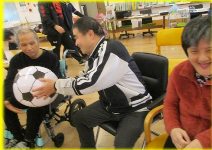
大きなサッカーボールで遊びました(〇〇) 円になって隣の人へ「はい!どーぞっ」