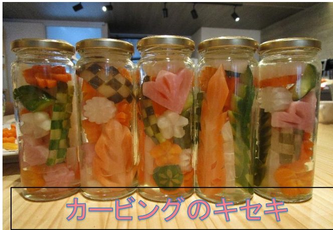
カービングのキセキ

綺麗に瓶詰めされており、見た目でも楽しめる商品。 現在3種類の味で楽しめるピクルスを販売中です（和風・洋風・スパイシー）。