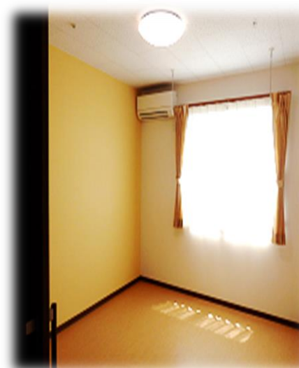
居室 11.59㎡エアコン完備